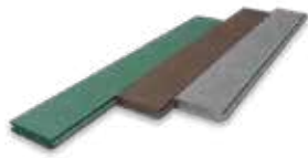
planken met veer- en groefverbinding