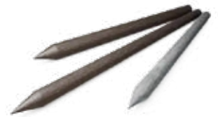
ronde & vierkante palen